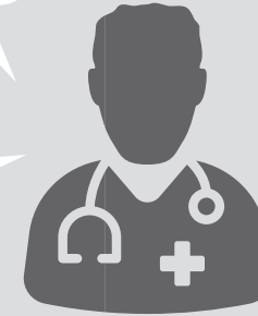
Schéma d'utilisation et durée de protection

Si vous envisagez une vaccination pour éviter la survenue de dommages pulmonaires, parlez-en à votre vétérinaire bien à l'avance.